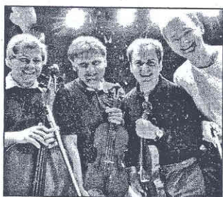
I musicisti dell'Aron Quartett